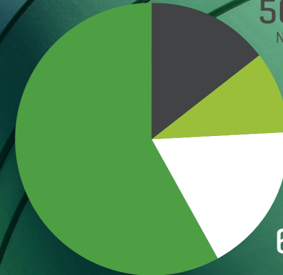
Grafik I: Ausgaben für Güter und Dienstleistungen (inklusive Investitionen)