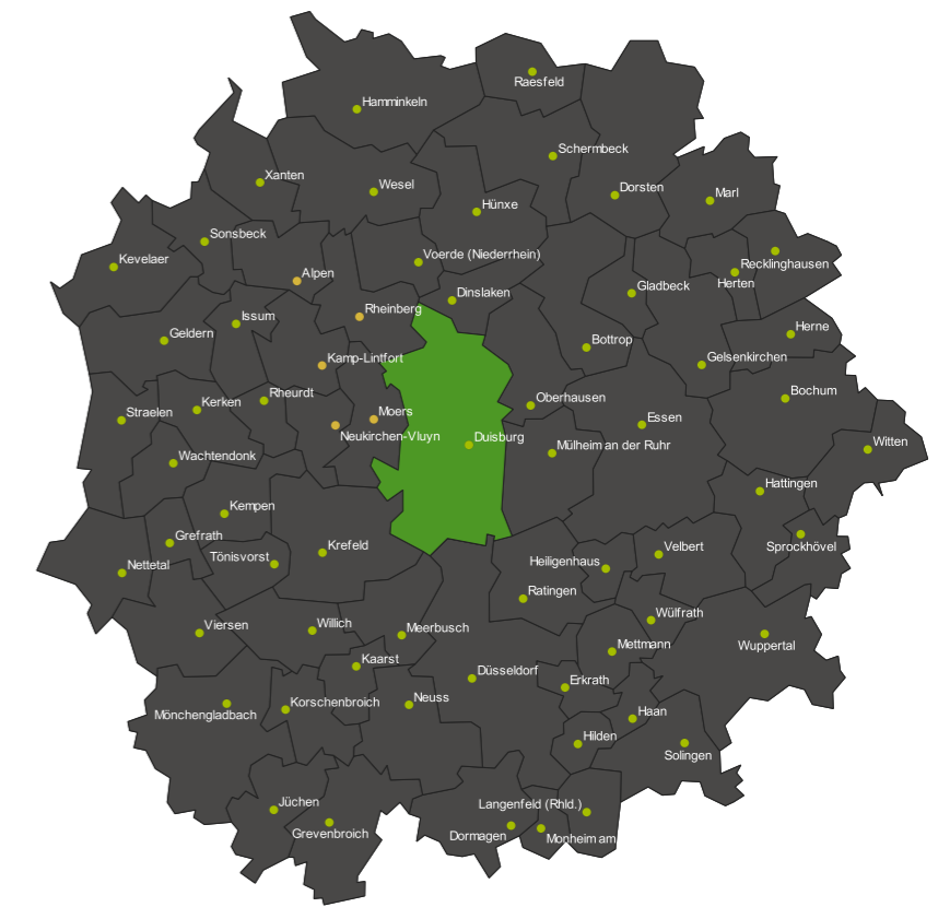
Grafik III: Unser Gebiet - Duisburg und die Region