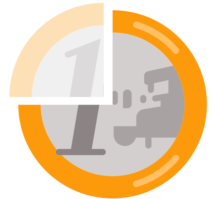
Grafik IV: Die gesamten Ausgaben der Stadtwerke Duisburg betragen 1.602,7 Mio. Euro. Von jedem Euro verblieben 59% in Duisburg und 75% in der Region [inklusive Duisburg].*